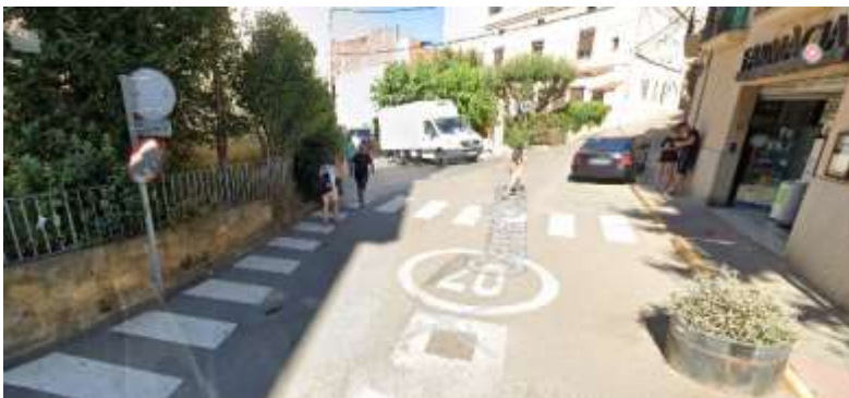
Font: Google Street View. Consulta gener 2024. Fotografia en la qual s'observa la qüestió de la consulta.

Es valorarà l'opció de posar pilones perquè els cotxes no envaeixin les voreres davant de l'ajuntament.