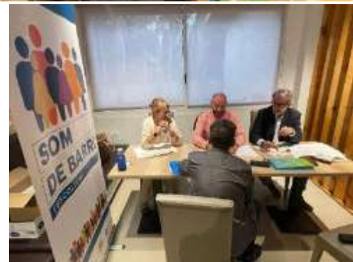
Fotografies de la sessió.