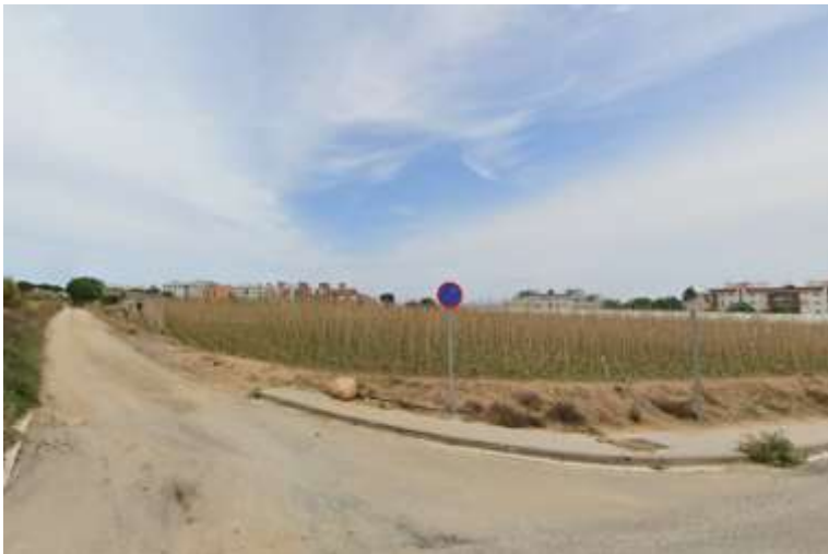
Font: Google Street View. Consulta novembre 2023. Cantonada del Camí del Sot i el Camí Pla de la Torreta on es veu la discontinuïtat de vorera construïda a les zones perifèriques del barri.

Aquesta qüestió fa referència a l'accés a la població des de la rotonda de la Marinada (camí pla de la Torreta fins a l'avinguda de Sant Andreu), on hi ha camps, i no hi ha vorera construïda. En aquests vials, s'hi farà un itinerari de vianants.